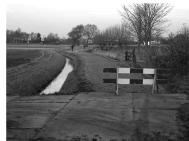
Dec. 2015: Verharding aangebracht

Inmiddels zijn we een aantal keren aangeschoven bij overleg tussen diverse betrokkenen en de gemeente Castricum. Bij dit overleg is afgesproken dat de dijk z'n oorspronkelijke vorm terug krijgt. Aan beide zijden zal een paaltje geplaatst worden om gemotoriseerd verkeer zoveel mogelijk te voorkomen. Tevens zullen er straatnaambordjes geplaatst worden waarvoor wij de naam "West Dijk" aan de gemeente hebben geadviseerd. Dit naar de naamgeving op de oudst bekende kaart van Akersloot uit 1680. De in de pers genoemde naam Westerhoogedijk was een naam die verwijst naar "Wester Hooghe Wegh/Dijck" die op oude kaarten voor komt voor de huidige Startingerweg/ Buurtweg.