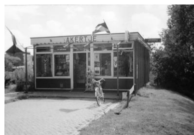
Drogisterij Zijp (noodwinkel), Beatrixlaan

Daarnaast het eerste winkelcentrum van Akersloot op het Churchillplein.