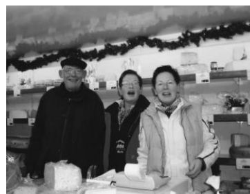
Kaandorp Kip en Kaas