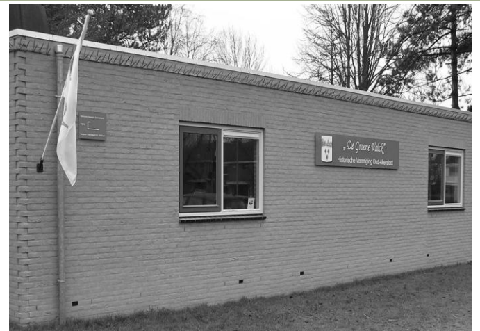
Verenigingsruimte HVOA voorzien van gevelbord.