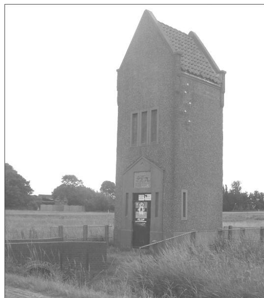
Penhuisje in Akersloot

Vandaar dat wij vanaf het begin nauw betrokken zijn bij de nieuwe invulling van het Hr. Derckplantsoen. Na publicatie van de eerste schetsontwerpen hebben wij ons hierover beraden en in juli 2011 tijdens een raadsbijeenkomst onze afkeur over het plan uitgesproken. In onze optiek was het allemaal veel te massief en stads wat totaal niet bij de dorpsomgeving paste. Ons betoog heeft als zodanig bijgedragen aan het afwijzen van het bouwplan. Vervolgens hebben we aan een tweetal "atelier-sessies" deelgenomen waarbij betrokkenen hun ideeën en wensen konden inbrengen. Dit heeft geresulteerd in een schetsontwerp voor een nieuwbouwplan, ditmaal van een andere architect wiens roots in het oude dorp liggen. Voornamelijk het in de architectuur refereren aan historische gebouwen als het penhuisje, Akersloter bollenschuren etc. en het in de te gebruiken materialen verwijzen naar o.a. de vroegere scheepsbouw spraken ons bijzonder aan.