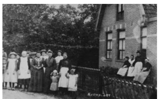
Oude Vrouwenhuis 'toen'